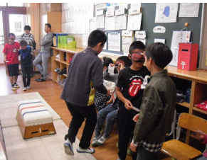
【4年めざせバリアフリー】