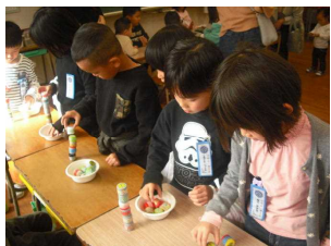
【2年作ろう遊ぼう工夫しよう】