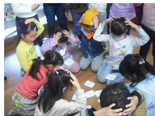
【3年発見!宮若じまん】