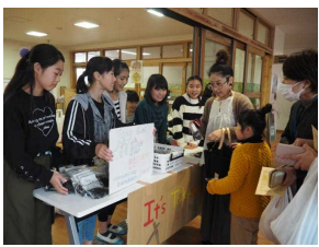
【6年みやわか今昔物語】 竹炭の販売

三年生以上は、「総合的な学習」として調査・探究活動を行っています。三年生は、宮若の自慢できるところを劇にしたり、クイズにしたり、カルタにしたりしました。四年生は、障がい者を中心とした福祉学習を行っており、アイマスク体験や点字体験ができるよう工夫していました。五年生は、自然環境を守ることに関する学習を行いました。実際に活動されている人から聞き取りをし、川を守るためにさまざまな努力がなされていることがよく理解できていました。六年生は、宮若の伝統文化について学習しました。年末に清水寺に並ぶ竹灯籠の由来や作り方を学び、制作体験コーナーを設けました。今年も、その竹灯籠が終わった後、竹炭として利用できることも学びました。一緒に焼いて作った竹炭の販売を行い、その収益は2万4千円です。今年水害で被災された方々に送ります。午後は、PTAバザーが行われ、大盛況でした。地域の方、コミュニティスクール関係の方、市教委の方も来校されましたが、PTA活動として行われている午後のこの事業に驚かされていました。