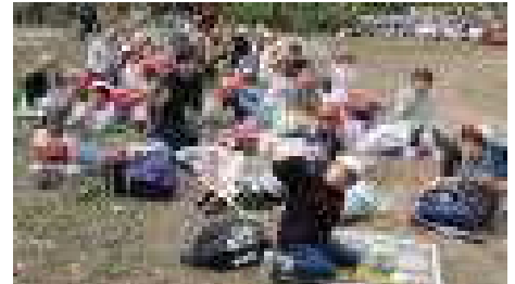
おいしいお弁当の時間です！ 学級で集まって、食べています。