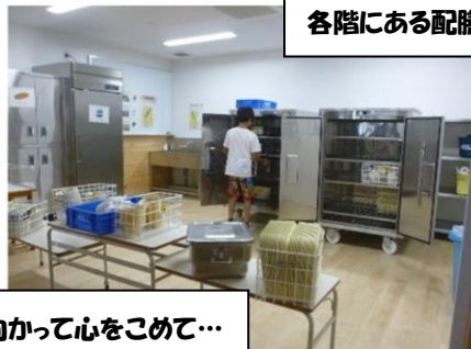
各階にある配膳ルーム