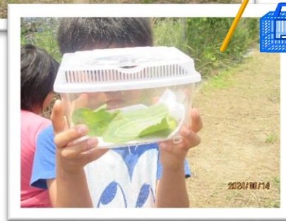
校庭の隅ではバッタを捕まえていました!