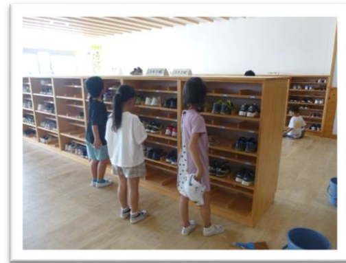
下駄箱の中もきれいに