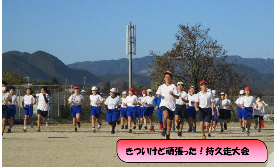
きついけど頑張った! 持久走大会