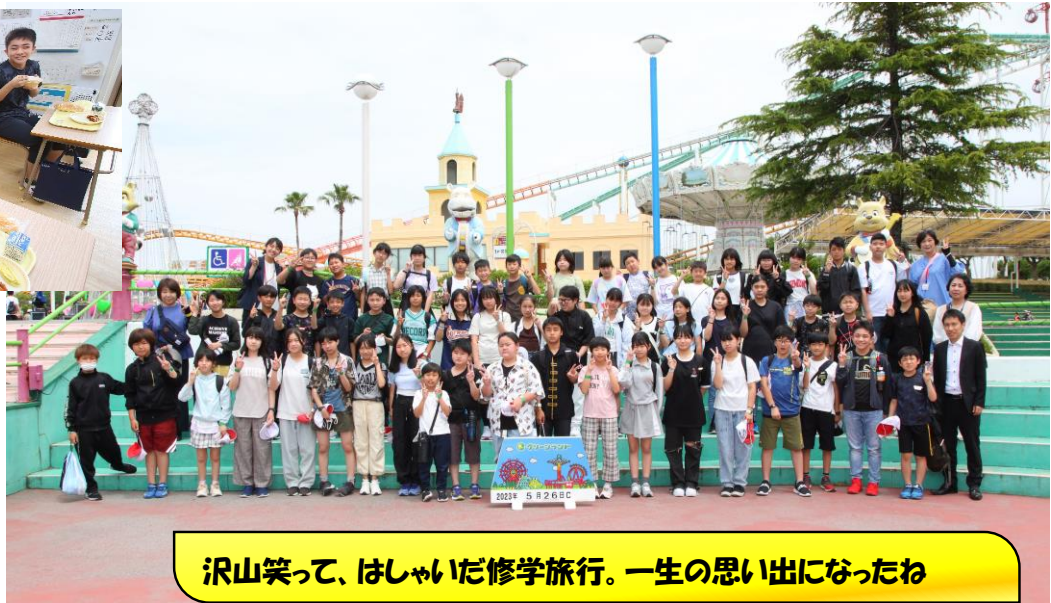
沢山笑って、はしゃいだ修学旅行。一生の思い出になったね