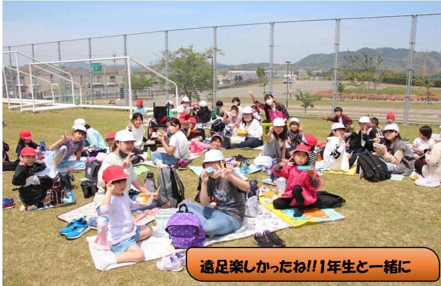
遠足楽しかったね!!1年生と一緒に