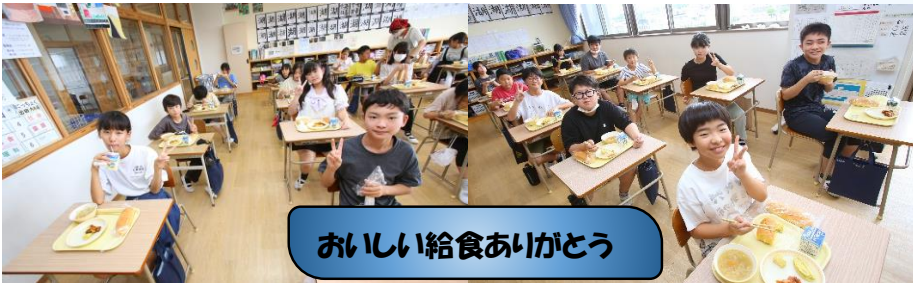
おいしい給食ありがとう