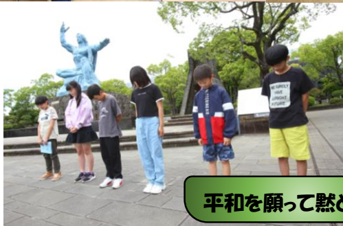
平和を願って黙とう…